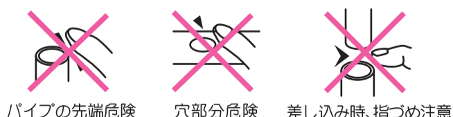
パイプの先端危険 穴部分危険 差し込み時、指づめ注意